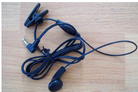
可以实现语单通话功能